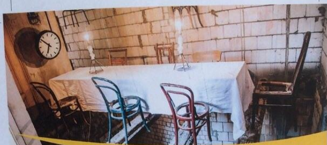
Zwei Kronen Haus zum Tag des offenen Denkmals 2016 Dům U dvou korun při dni otevřených památek 2016