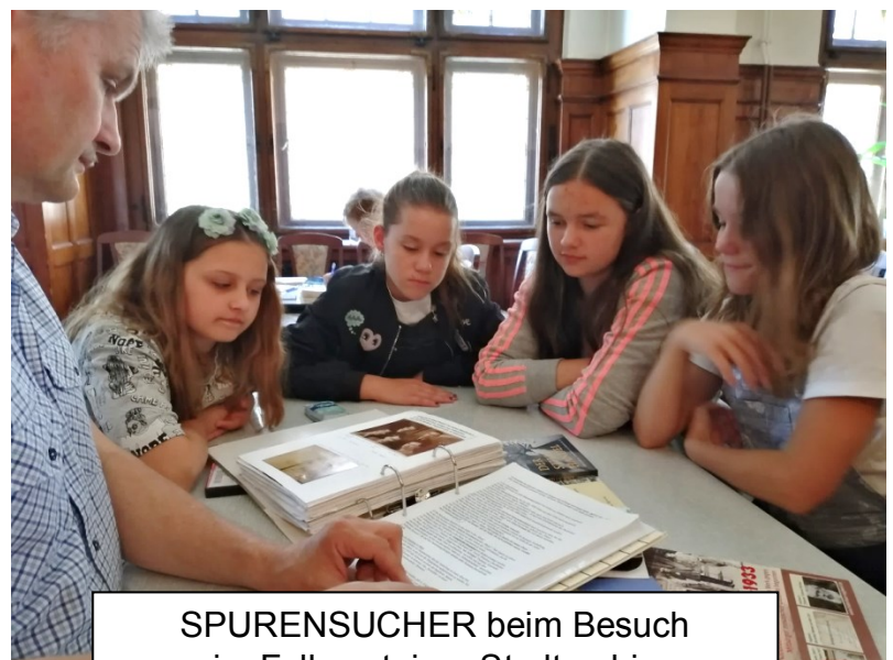
SPURENSUCHER beim Besuch im Falkensteiner Stadtarchiv