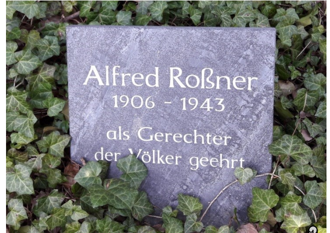
Gedenktafel auf dem Falkensteiner Friedhof

Das Spurensucher-Team aus der W.-A.-v.-Trützschler-Oberschule Stadt Falkenstein